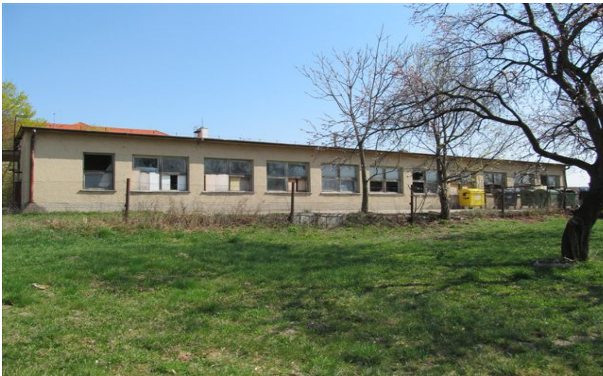
budova súpisné číslo 460 – vrátnica