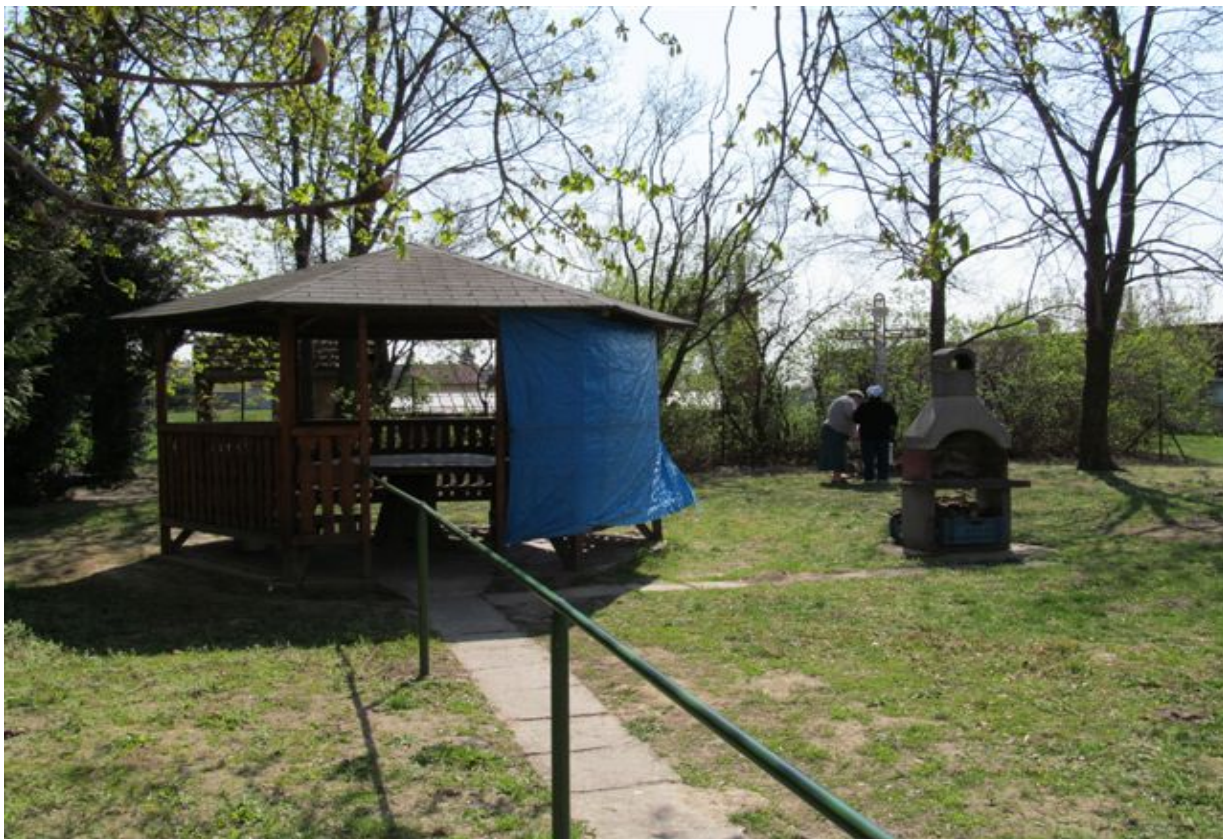
artézská studňa – bez súpisného čísla