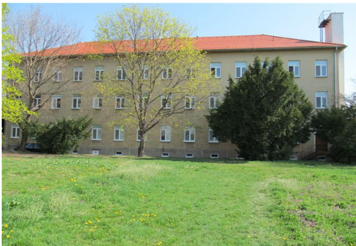
budova súpisné číslo 457 – sušiareň