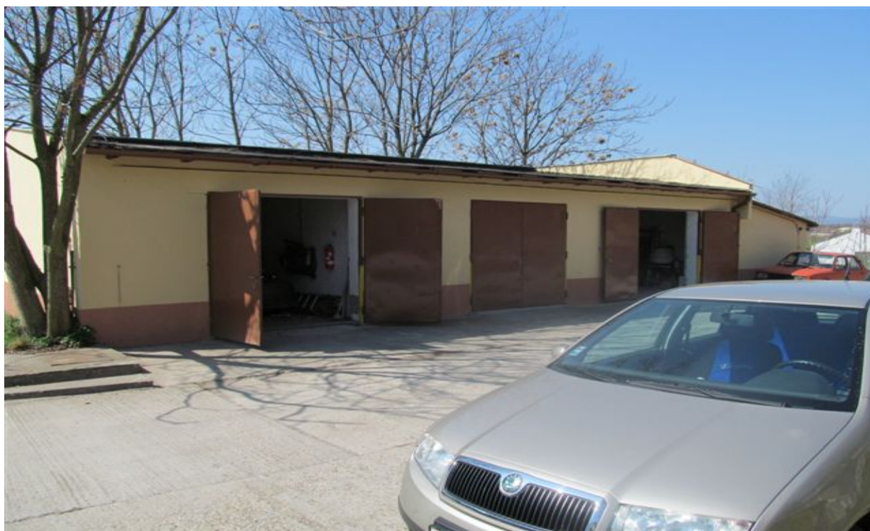
budova súpisné číslo 462 – kôlna