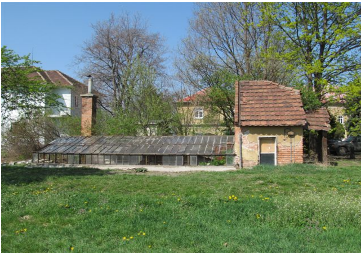
altánok – bez súpisného čísla